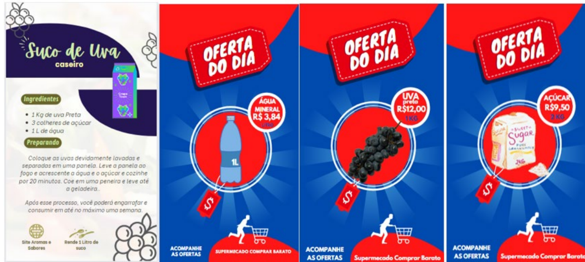
Figura 2. Imagem da Receita e dos valores dos ingredientes presentes na atividade. A pesquisa.

Para continuar a investigação e o processo de resolução, ocorreu a divisão da sala em grupos, quando notou-se que os alunos se reuniram por critério de afinidade para prosseguir e pesquisar. Encontraram o gasto com ingredientes para produzir um litro de suco de uva, iniciando a etapa de Matematização (Biembengut & Hein, 2021). Mediante a investigação, os alunos observaram que na receita só iriam três colheres de açúcar, porém no supermercado só vendem em embalagens de 1 kg, 2 kg ou 5 kg. Na atividade foi utilizado o valor de 2 kg de açúcar, para o que foi preciso uma pesquisa na Internet. Para encontrar quantos gramas possuía uma colher de sopa de açúcar, decidiram utilizar a regra de três simples para realizar as transformações de grandezas e medidas. Encontraram depois o valor de R$ 0,17 para três colheres de açúcar. Com a informação de quantos mililitros de líquido produzia 1 kg de uva, foram realizados os cálculos usando novamente a regra de três na determinação de quantos quilogramas de uva eram necessários para a produção de 1 litro de suco.